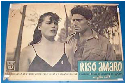
RISO AMARO (G. De Santis) I 1949, b/w, 108 min

Regia : G. De Santis; soggetto: G. De Santis, C. Lizzani, G. Puccini Sceneggiatura: G. De Santis, G. Puccini, C. Alvaro, C. Musso, I. Perilli Fotografia : O. Martelli Scenografia: C. Egidi Musica: G. Petrassi, A. Trovatoli Montaggio: G. Variale Interpreti : R. Vallone (il sergente), V. Gassman (Walter), D. Dowling (Francesca), S. Mangano (Silvana), C. Rissone (Aristide), N. Pepe (Beppe), A. Sivieri (Celeste) Produzione : D. De Laurentis Distribuzione : Lux Film