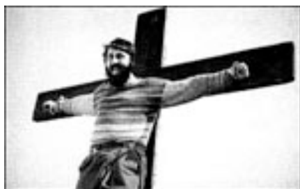
TOTO' CHE VISSE DUE VOLTE (Daniele Cipri, Franco Maresco) I 1998, 95'

Produced by Karl Baumgartner (III) Original music by Goran Bregovic Cinematography by Vilko Filac Film Editing by Branka Ceperac Production Design by Miljen Kreka Kljakovic Costume Design by Nebojsa Lipanovic Language: Serbian / German Sound Mix: Dolby Digital